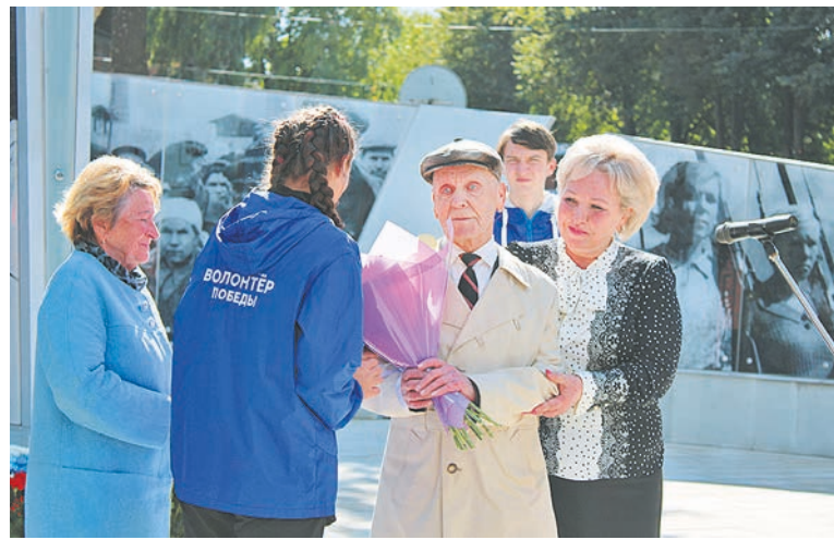
На открытие стелы «Боровичи – город трудовой доблести»

На 533-м заседании Совета Федерации состоялся «Час субъекта Российской Федерации». Об актуальных вопросах строительства социальных объектов и развитии инфраструктурных объектов на территории Новгородской обла-