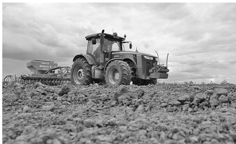
Новгородский АПК в прошлом году произвел продукции на сумму более 33 млрд рублей.

– Структура посевных площадей не меняется: более 4,4 тысячи га – это картофель, около 2 тысячи га – овощи, 7,6 тысячи га – зерновые культуры. Вся нормативно-правовая база для обеспечения аграриев государственной поддержкой принята. Крестьянам перечислено более 211 млн рублей, в том числе – 65 млн рублей на весенние полевые работы, – уточнила Елена Покровская.