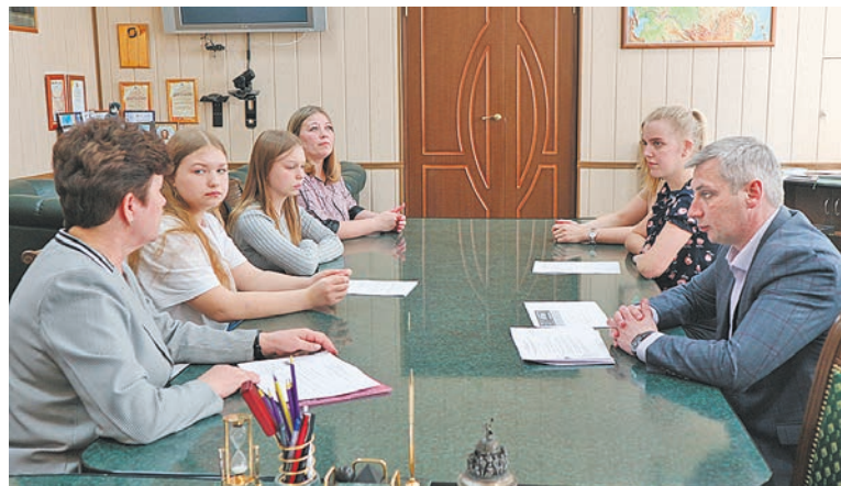
Глава района Андрей Герасимов обсуждает проект спортплощадки с активистами поселения