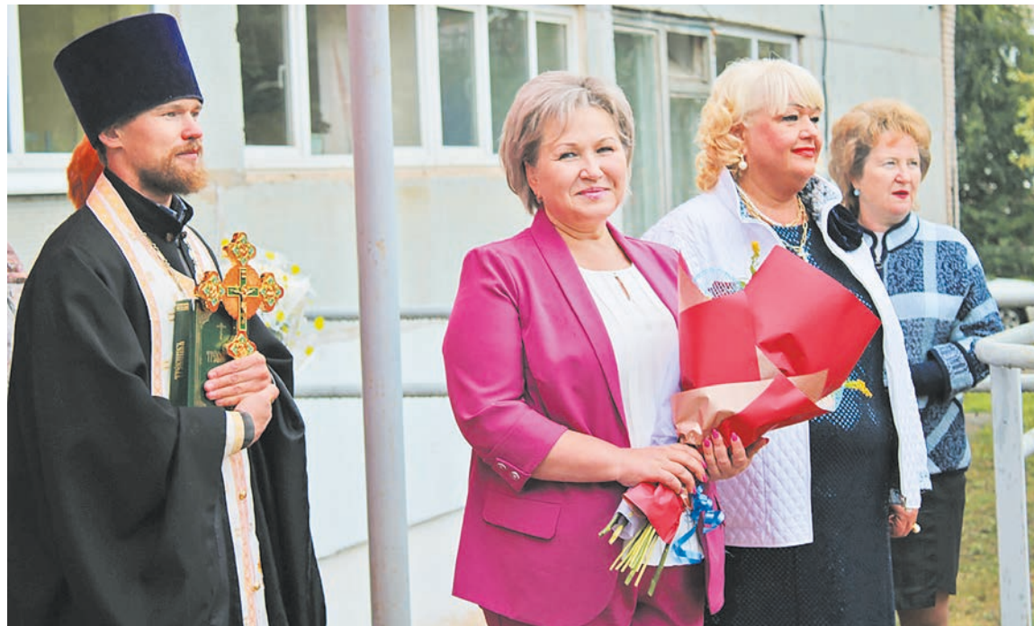
На торжественной линейке в седьмой школе

Например, на площадке Института детства Московского педагогического государственного университета провела круглый стол на тему «Ресурсы и перспективы модернизации программ подготовки кадров для системы образования детей с инвалидностью и ограниченными возможностями здоровья». Обсудили актуальные вопросы в сфере подготовки и переподготовки дефектологов и педагогов, вопросы модернизации существующих образовательных программ, организации воспитательной деятельности, практической и вожатской подготовки, подготовки научно-педагогических кадров в области коррекционной педагогики. Подробно остановились на рассмотрении различных моделей образовательных программ, которые предполагают получение диплома с двумя квалификациями.