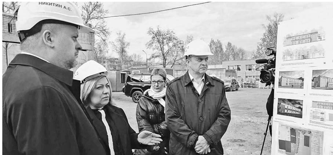
Глава региона Андрей Никитин побывал на площадке нового центра и посмотрел, как ведётся капитальный ремонт здания под эти нужды.

Стоит отметить, что во всех районах и округах с каждым ветераном и каждой семьей погибшего будут работать свои социальные координаторы. Уже сформирован предварительный состав из 25 специалистов, которые пройдут обучение в мае, с последующим трудоустройством в представительство Фонда.